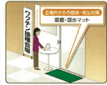
会場入りイメージ