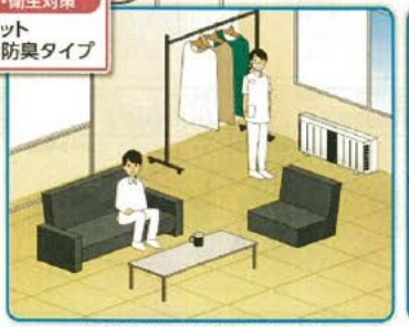
医療関係者控室内イメージ