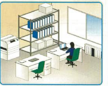
ワクチン接種事務室内イメージ